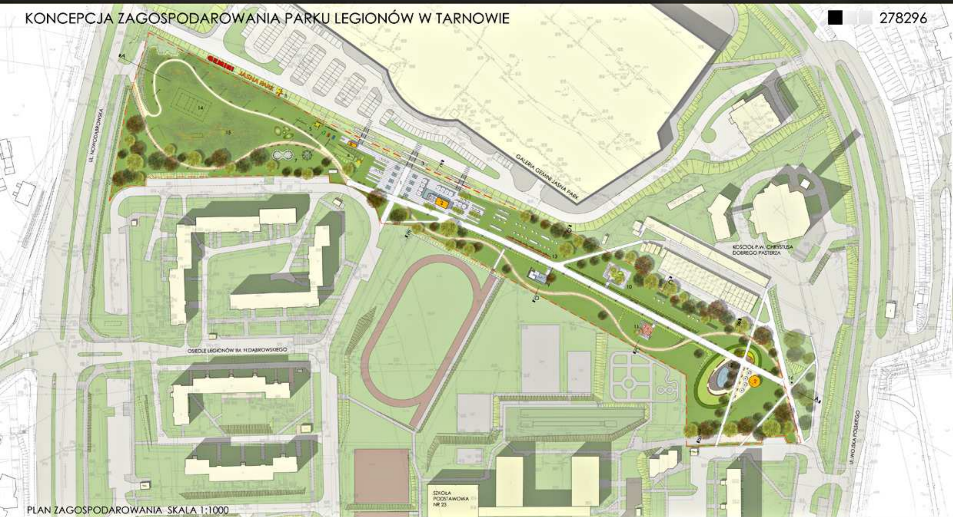
PLAN ZAGOSPODAROWANIA SKALA 1:1000