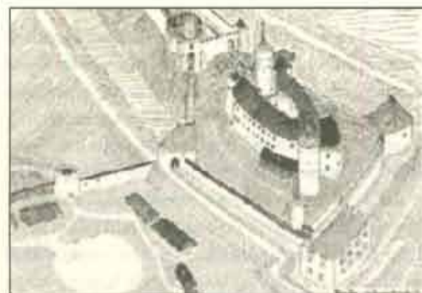
Tarnówi várat bemutató grafika

Így 1526-ban Tokajban a nemesi párt, miután az idegen uralkodókra fogták a súlyos vereséget, királlyá kiáltották ki Zápolyait (novemberben koronázták). Eközben összehívtak egy országgyűlést Pozsonyban, és az 1515. évi bécsi egyezmény alapján királlyá választották Habsburg Ferdinándot, akit korábban már cseh királlyá koronáztak. Így kezdődött meg a következő polgárháború.