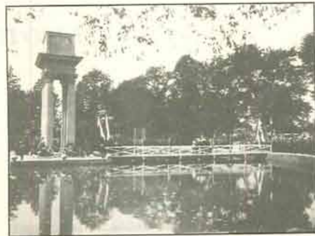
Bem József gen. hamvainak a nyugalomra helyetése a Strzelecki Parkban lévő Mauzóleumba

Bem József gen. maradványainak a hazahozatalával és mauzóleumában való elhelyezésével sokat nyer Tarnów is. De vajon nem veszít-e vele sokat maga Lengyelország? elmélkedtek az újságokban. Hosszas gondolkodás után végül elhatározták, hogy a hős örök nyugalmi helyének szülővárosában Tarnóiban kéne lennie. Bem József gen. maradványainak a hazahozatali akciója és mérete egészen különös volt. Az egész művelettel kapcsolatos protektorátumot az állami hatalom vette át. Az országos „Bem J. Gen. Holttestének a Hazahozatala Bizottság” főleg a generális hamvainak Lengyelországba történő deportációjával kapcsolatos diplomáciai jegyzetek cseréivel foglalkozott.