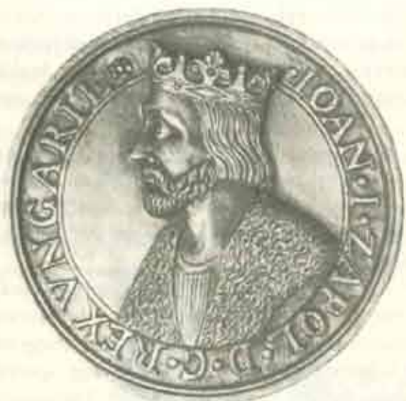
Érme Zápolya János arcképével

Zápolya az ország többségén uralkodott, és a még meg nem koronázott német királyt csak néhány nyugati bizottság támogatta. De Ferdinánd nem mondott le 1527-ben belépett Magyarországra egy hatalmas sereggel, megverte Zápolyi hadseregét (1527.IX.25 Tokajon) és Belgrádon királlyá koronáztatta magát. Így módon Magyarország egyszerre két királlyal rendelkezett: János (1526-1540) és I. Ferdinánd (1526-1564). Zápolya először Erdélyben talált menedéket. A mediációt I. Öreg Zsigmond lengyel király kezdte, az olomuci összejöveten (1527. július), de sikertelenül járt. Említést érdemel, hogy mindkét választottnak Jagelló családból származó felesége volt.