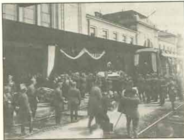
Bem József gen. hamvait szállító speciális vonat ünnepélyes fogadtatása

Problémás ügyet okozott Bem maradványai elhelyezési helyének a megállapítása. Hirtelen nagyon népszerűvé vált, így több koncepció jött létre a holttestének az elhelyezésére vonatkozólag. Annak ellenére, hogy elejétől fogva figyelembe vették Tarnó-ot, itt és másutt is hallani lehetett ajánlatokat, amelyek az ország fővárosát pártfogolták a Wawel domboldalával szemben. „Morálisan nyerne rajta egész Lengyelország és a nagy hős emléke.