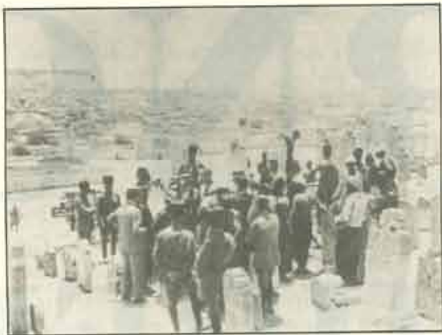
Bem József generális holttestének a hantolása Lengyelország, Franciaország, Magyarország és Törökország hivatalos képviselője mellett

Tarnów csodálatosan fogadta a hősi fiát. 1929 június 30. valódi ünnep volt az egész tarnówi társadalom számára. Különösen imponálóan néztek ki a feldíszített peronok, az utcák, épületek, a lógó zöld virágfüzerek, a három ország színében ragyogó válszalagok, a piros-fehér zászlók, az egyenruhás vasutasok, lövészek, cserkészek soralakulata.