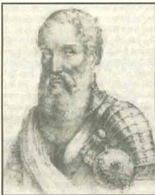
Jan Tarnowski hetman

Közép-Európában ekkor három hatalmas birodalom uralkodott, a Jagellók, a Habsburgok és az Ottomán Birodalom, e három birodalmi övezet hatásaitól függött Magyarország, Szt. István koronaöröksége. A Habsburg hatalomtól való félelem elől még Franciaországot és a pápát is provokálták, hogy azok fontosabb szerepet töltsenek be ebben a régióban. Ebben az egész császári és mágnási érdeki és családi megosztottsági labirintusban találta magát Tarnów. A XVI. század vége felé láthatóan körvonalazódott a nemesség osztálya, a kis és közepesek a magyar mágnásokkal szembeni megerősödése. A következő választások biztosították az újabbnál újabb politikai jogokat. Ezidőben alakult meg a formális nemesi párt, amelynek célja a mágnásokkal való kiegyenlítődési politikai harc volt, de főleg akkor vált igen jelentőssé, amikor ennek Zápolya János