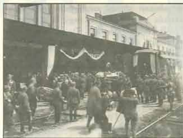
Bem József gen. hamvait szállító speciális vonat ünnepélyes fogadtatása

Problémát okozott azt, hol helyezték örök nyugalomra Bem hamvait. Hirtelen nagyon népszerű lett, így több tervet dolgoztok ki erre vonatkozóan. Annak ellenére, hogy kezdettől fogva figyelembe vették Tarnów-ot, az ország más településeire is hallani lehetett javaslatokat.