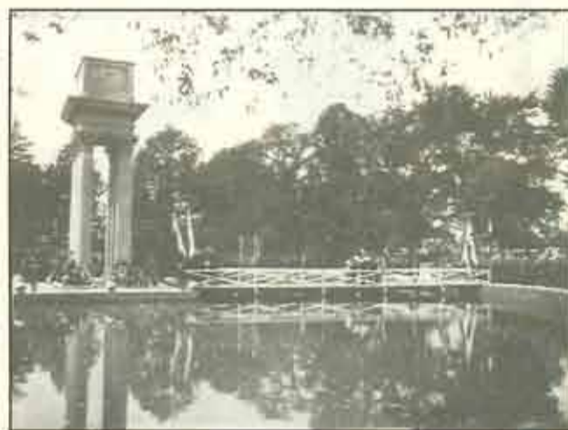
Bem József gen. hamvainak a nyugalomra helyetése a Strzelecki Parkban lévő Mauzóleumba

Budapestről a koporsót katonai delegáció kísérte. Minden állomáson, melyen áthaladt a vonat sorban álltak az emberek fedetlen fővel. A vasúti kocsikra virágokat szórtok. Június 29-én a kocsit Bem J. gen. hamvaival átlépte Lengyelország határát, ahol kivételes ünnepélyességgel fogadták. Az imponáló felvonuláson a Lengyelország, Magyarország és Törökország lobogóival feldíszített koporsót a Wawelre szállították, ahol több órára kiállították az árkádos udvarban, tiszteletbeli őrség mellett. A következő napon Krakkó utcáin vezetett végig az ünnepélyes gyászmenet, hogy azután 21 sortűzlövés mellett elbúcsúzzon a szülővárosába induló hőstől.