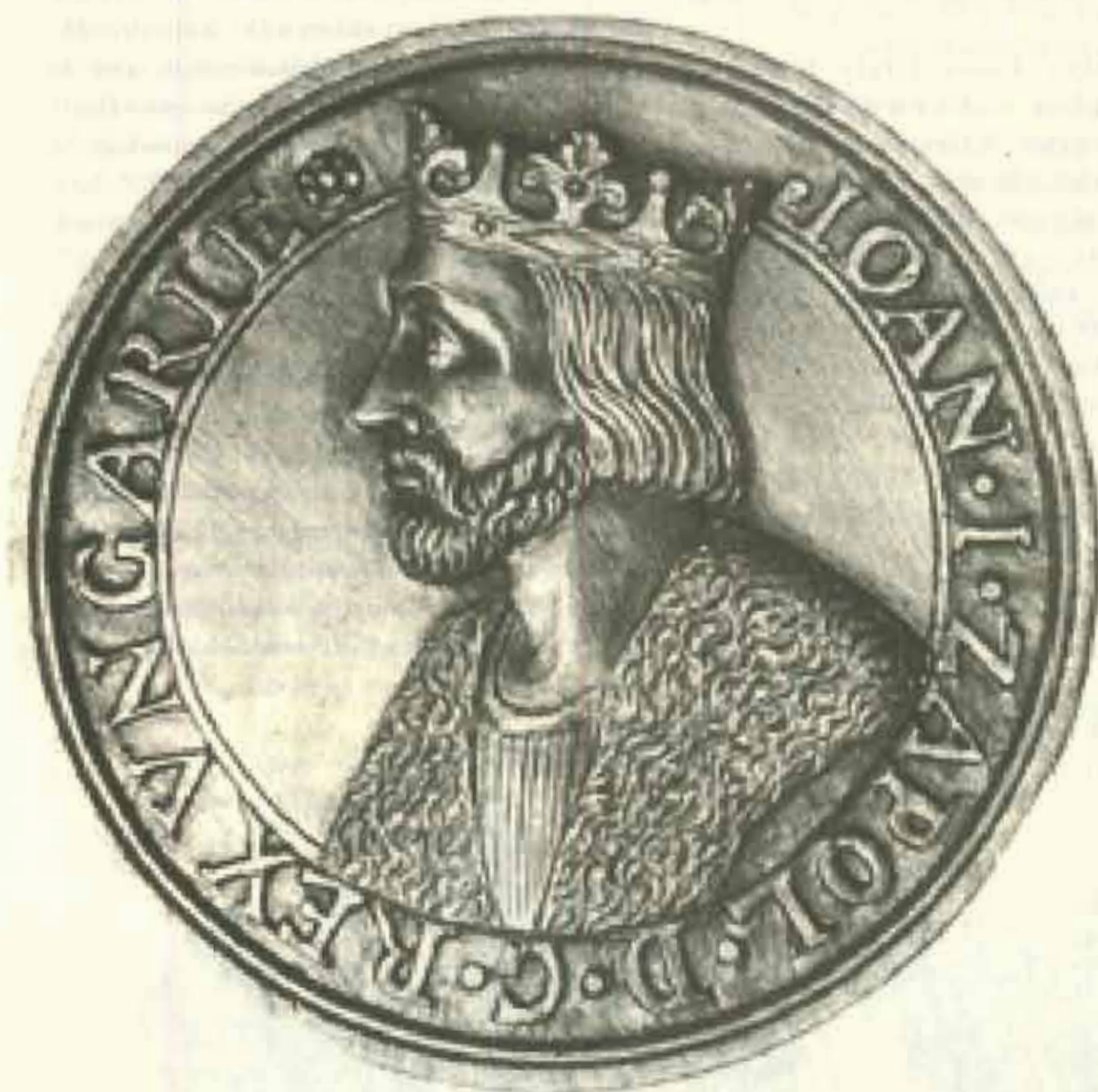
Érme Zápolya János arcképével

1528 áprilisától szeptemberéig Tarnówban szállásolt az akkori magyar király, Zápolya János (Szapolyai) és egész Európa szeme a Sz. Márton hegyre és a Jan Tarnowski hetmannál szórakozó kivételes vendégre irányult.