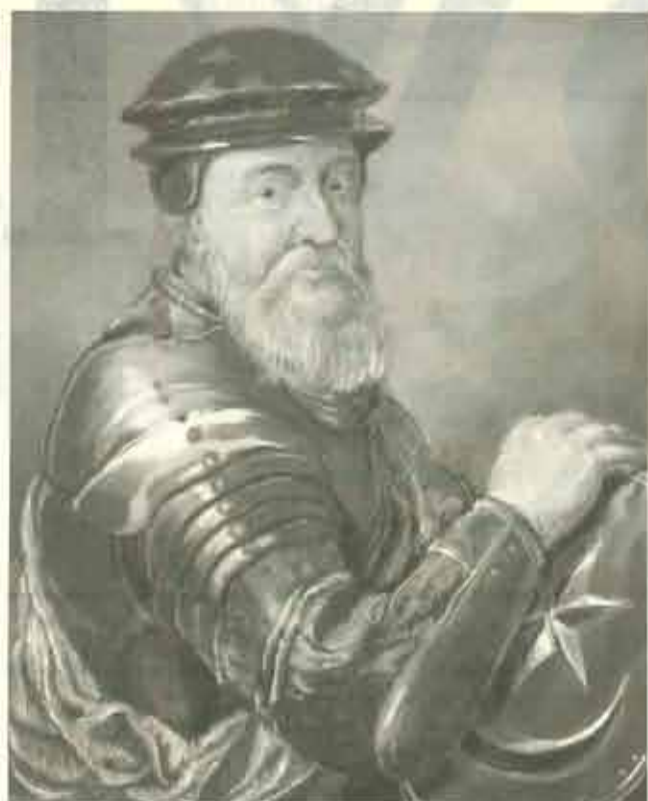
Jan Tarnowski hetman

Az egyre erősödő belső ellentétek, gazdasági-társadalmi konfliktusok (pl. az 1514. évi parasztfelkelés) meggyengítették az országot a törökországi háború perspektívájában. A pogányok elleni háborúra való felhívásra felszólító pápai bulla kiadása után sikerült összehozni egy közel 80 000-es sereget, amely főleg a szegénység miatt állt össze, és teljesen felkészületlen volt, ami teljes vereséget jelentett az 1516-os Mohácsi csatában.