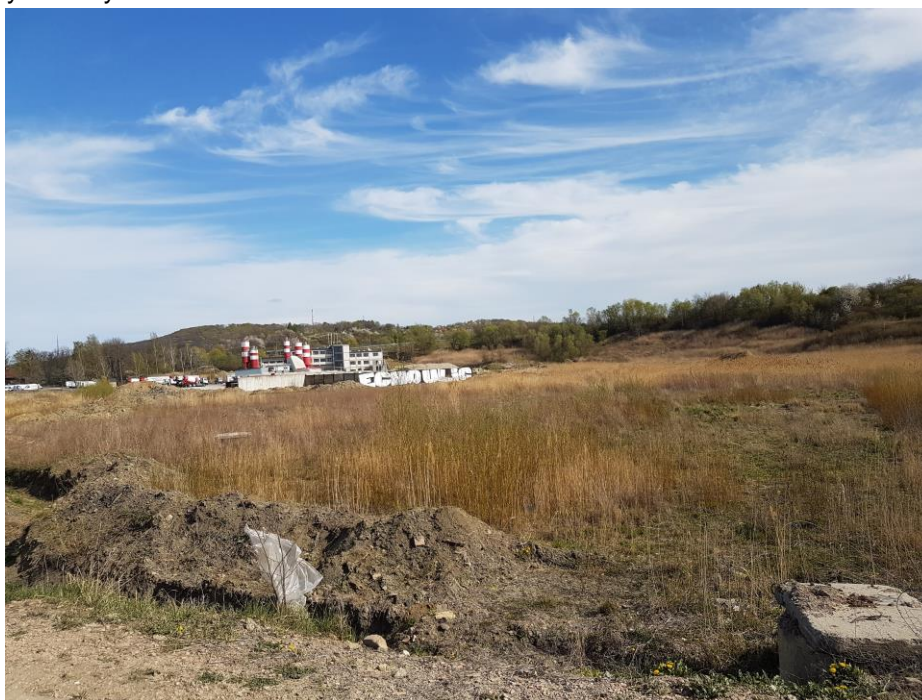
Zdjęcie 3 Synantropijna roślinność w centralnej części opracowania (miejsce pod dawnej eksploatacji ceramiki budowlanej)

Część centralna obszaru opracowania, gdzie niegdyś eksploatowane było złożo ceramiki budowlanej, pokryta jest częściowo zieleńią synantropijną, która samoistnie „wkroczyła” na tereny niezagospodarowane. Jest to zieleń o małych walorach przyrodniczych. Natomiast znaczna część powyższych obszarów poeksploatacyjnych nie jest jeszcze pokryta żadną roślinnością, ponieważ teren ten został stosunkowo niedawno zrehabilitowany.