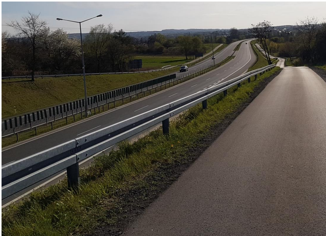
Zdjęcie 6 Widok na drogę krajową nr 94

Natężenie ruchu na drodze nr 977 na odcinku Tarnów-Nowodworze (odcinek ten przylega bezpośrednio do ul. Tuchowskiej, która stanowi przedłużenie powyższej drogi) wg Generalnego Pomiaru Ruchu w 2015 r. wynosiło 12 746 pojazdów na dobę. Jest to wartość bardzo wysoka. Ruch kołowy jest bardzo uciążliwym źródłem hałasu w środowisku. Na poziom hałasu komunikacyjnego mają wpływ czynniki związane z warunkami ruchu, parametrami drogi, rodzajem pojazdów. Należy zaznaczyć, iż zagrożenie środowiska hałasem drogowym znacznie wzrasta, co spowodowane jest przede wszystkim wzrostem liczby pojazdów.