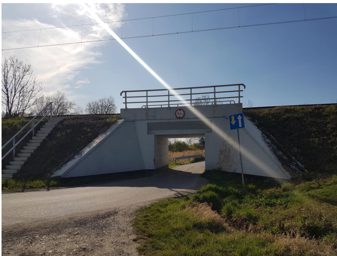
Zdjęcie 7 Ul. Rude-Młyny w miejscu przecięcia z linią kolejową Tarnów-Leluchów, przebiegającą na wiadukcie – miejsce przedostania się wód powodziowych na obszar opracowania

Na obszarze opracowania zgodnie z Informatycznym Systemem Osłony Kraju znajdują się obszary szczególnego zagrożenia powodzią od rzeki Biała Tarnowska, obejmujące obszary na których prawdopodobieństwo wystąpienia powodzi jest średnie i wynosi raz na 100lat (Q 1%) a także obszary, na których prawdopodobieństwo wystąpienia powodzi jest niskie i wynosi raz na 500 lat (Q 0,2%). Obszar ten znajduje się w zachodniej części obszaru objętego opracowaniem, przy styku ul. Rudy-Młyny z linią kolejową Tarnów-Leluchów. Obszar ten w granicach planu miejscowego obejmuje powierzchnię 6800 m 2 . Na obszar opracowania woda z rzeki Białej może dostać się poprzez ul. Rude-Młyny, przebiegającą pod linią kolejową Tarnów-Leluchów, znajdującą się w tym miejscu na wiadukcie.