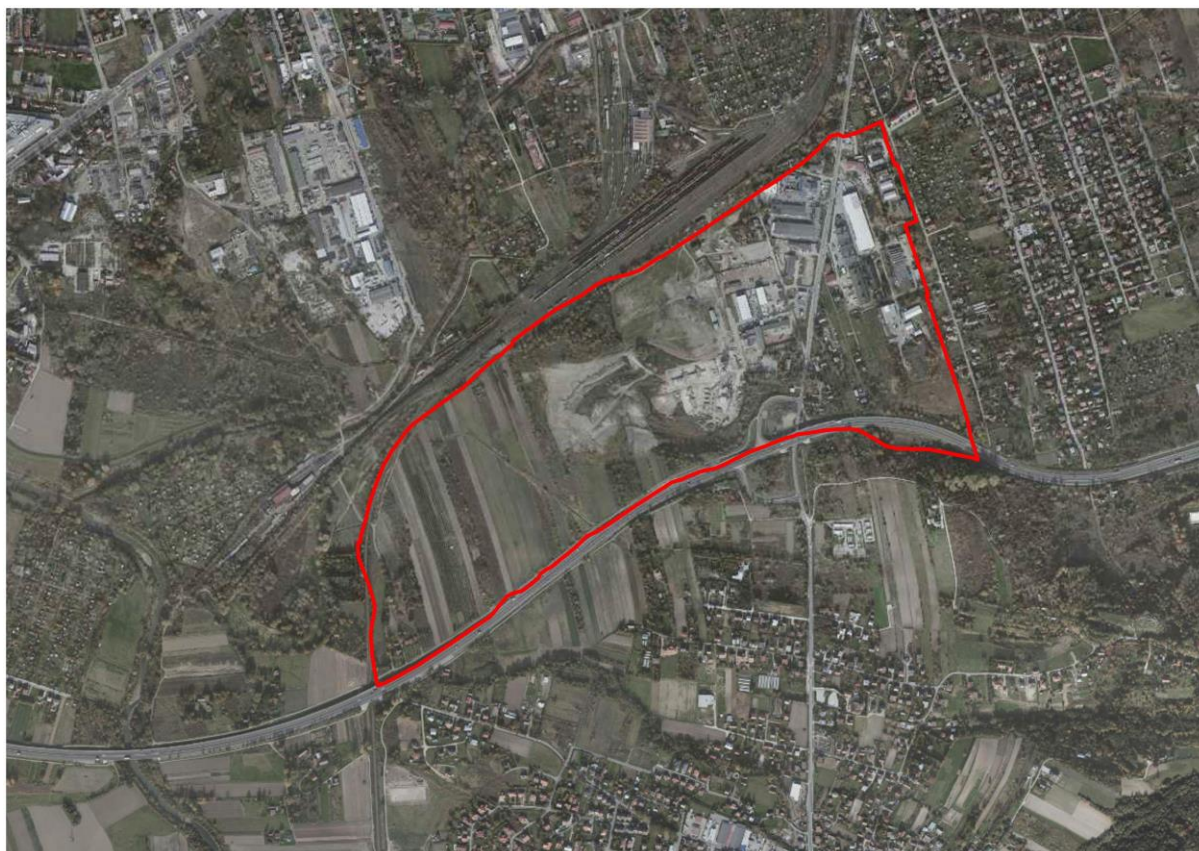
Rysunek 2 Widok „z lotu ptaka” na obszar objęty ustaleniami planu miejscowego.

Krajobraz obszaru opracowania charakteryzuje się w jego centralnej i zachodniej części dużym udziałem gruntów rolnych wykorzystywanych rolniczo. W części środkowej obszaru znajdują się niewielkie wyrobiska poeksploatacyjne (miejsce dawnego wydobycia surowców ilastych ceramiki budowlanej). Część wschodnia natomiast, położona wzdłuż ul. Tuchowskiej oraz odchodzących od niej dróg dojazdowych, jest dość intensywnie zagospodarowana budynkami produkcyjnymi, usługowymi oraz w mniejszej części również mieszkalnymi.