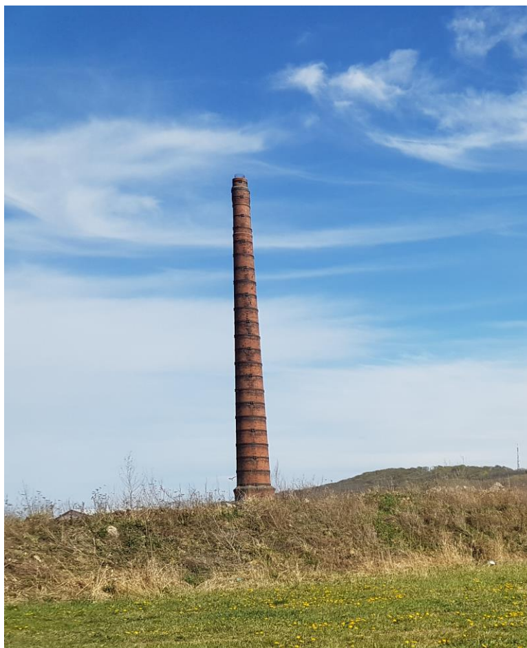
Zdjęcie 4 Komin z 1927 r. zlokalizowany na działce nr 25/49 obręb 0310 ujęty w gminnej ewidencji zabytków.