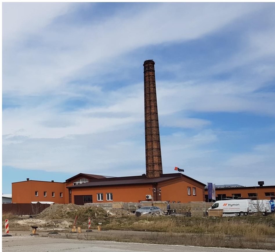
Zdjęcie 5 Komin zlokalizowany przy ul. Dojazd 16A ujęty w gminnej ewidencji zabytków