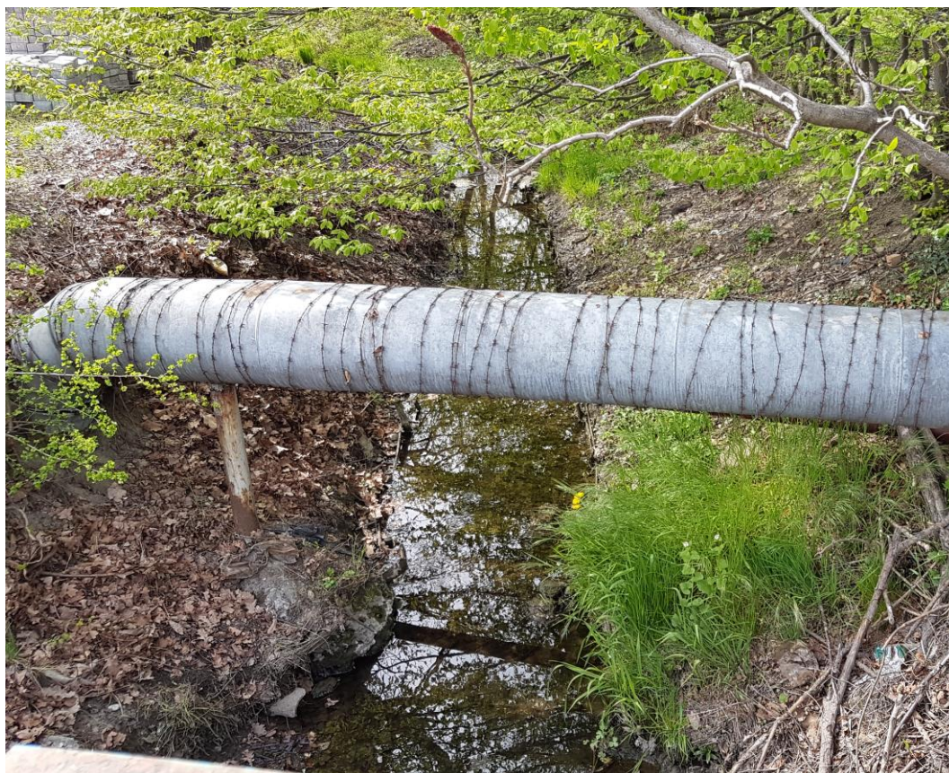
Zdjęcie 1 Rzeka Strusinka na terenie bezpośrednio przyległym do obszaru opracowania