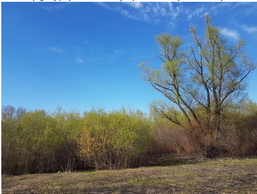
Zdjęcie 2 Zadrzewienia i zakrzewienia położone w środkowo-północnej części opracowania

zadrzewione, położone głównie w środkowo-północnej jego części przy północnej granicy opracowania a także nielicznie na pozostałych terenach. Ponadto na obszarze opracowania znajduje się również zieleń urządzona towarzysząca zabudowie i infrastrukturze komunikacyjnej. Często są to zadrzewienia przypadkowe, niepielęgowane, wymagające uporządkowania. Na analizowanym obszarze w jego wschodniej części niewielki odsetek zieleni stanowią ogrody przydomowe towarzyszące zabudowie jednorodzinnej.