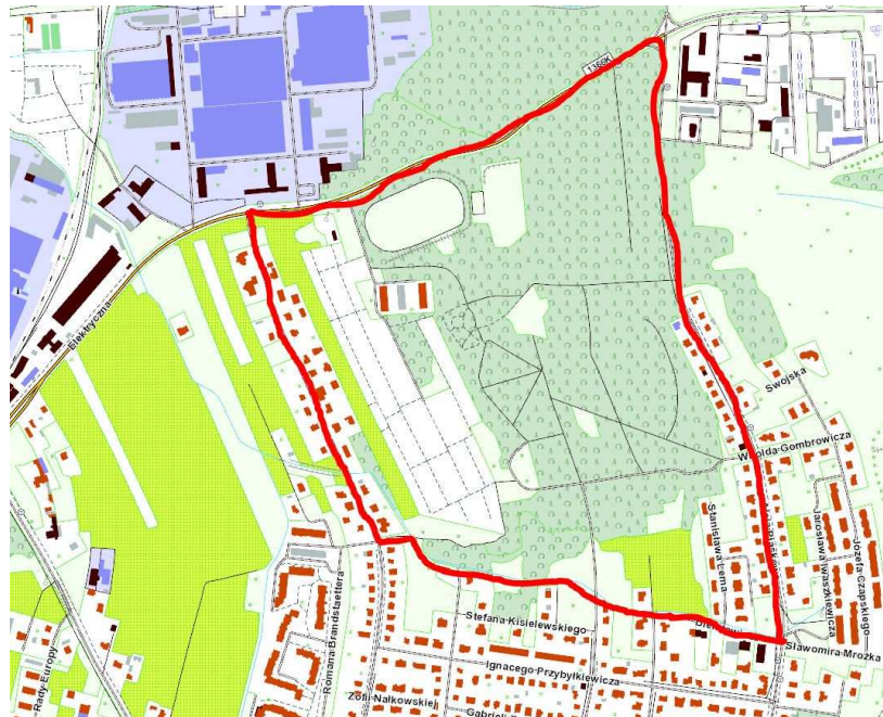
Rys. 1 - Obszar opracowania

Obszar objęty planem obejmuje tereny o powierzchni ok. 47,85 ha. Znajduje się w środkowej części miasta Tarnowa. Od północy ograniczony ulicą Elektryczną od zachodu ul. Jastruna od wschodu Aleją Parkową od południa częściowo ulicą Bielatowicza częściowo Potokiem Klikowskim. Dominującym typem zabudowy mieszkaniowej są tradycyjne domy jednorodzinne wraz z towarzyszącymi im zabudowaniami gospodarskimi, które znajdują się na obrzeżach obszaru opracowania. W jego centralnej części znajduje się kompleks parkowy – Park gminy Piaskówka (uchwała nr IX/120/2003 z dnia 3 kwietnia 2003r), który od zachodniej strony sąsiaduje z kompleksem ogródków działkowych. W północnej części znajduje się enklawa zabudowy wielorodzinnej (2 budynki) oraz kompleks sportowo-rekreacyjny. Pozostałe tereny stanowią obszar zielni nieurządzonej. Południowa część wzdłuż potoku Klikowskiego jest obudowana zielenią przywodną. W bezpośrednim sąsiedztwie terenu objętego opracowywanym miejscowym planem zagospodarowania przestrzennego przebiega istotny z punktu widzenia komunikacyjnego miasta szlaki komunikacyjne droga wojewódzka nr 973.